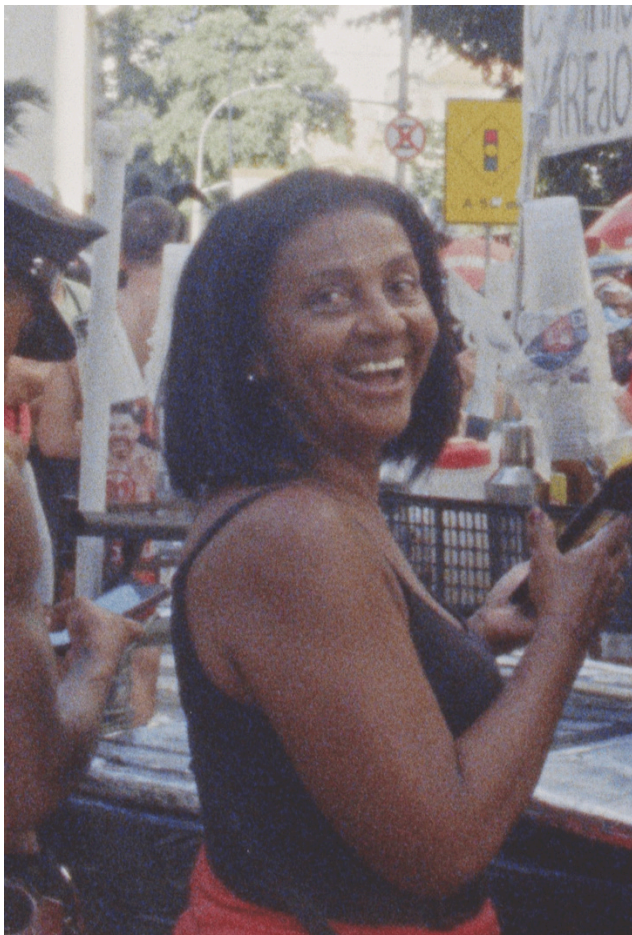
O Rio de Janeiro Continua Lindo - Felipe Casanova

24 films d'une durée comprise entre 6 et 32 minutes