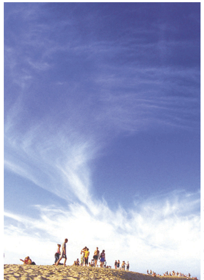
Lila de Broadcast Club