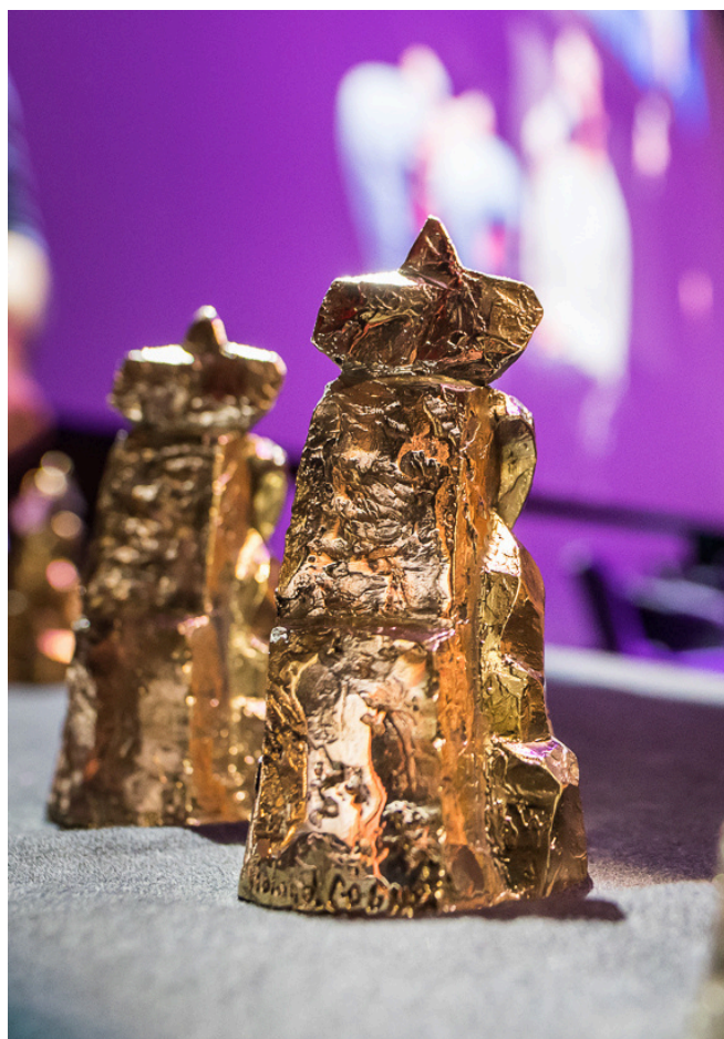
Tous les trophées "Vercingétorix" ont été réalisés d'après l'œuvre originale de Roland Cagnet.

Selon les compétitions (internationale, nationale, labo ou XR) ou des programmes dans lesquels les films sont présentés, ils peuvent remporter un Vercingétorix.