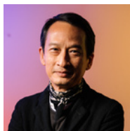
Trần Anh Hùng